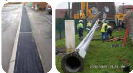
Deux mats mis à bas

Par ailleurs, des trottoirs ont été refaits en enrobé rue Jean-Sébastien Bach et chemin latéral (près de la maison des associations, dont les travaux de rénovation s'achèvent également).