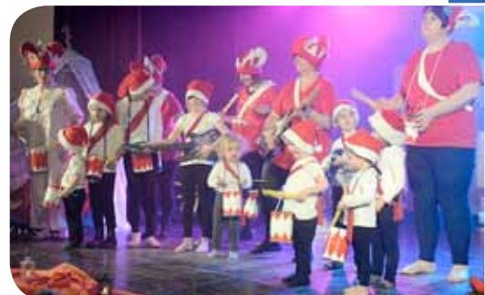
La magie a gagné les petits et a su sensibiliser les grands...