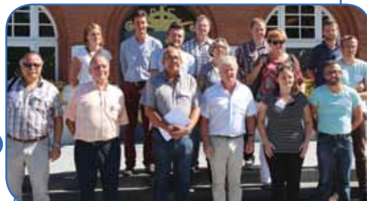
Autour du Maire, le jury au complet, les techniciens de la Ville et quelques élus avant la visite