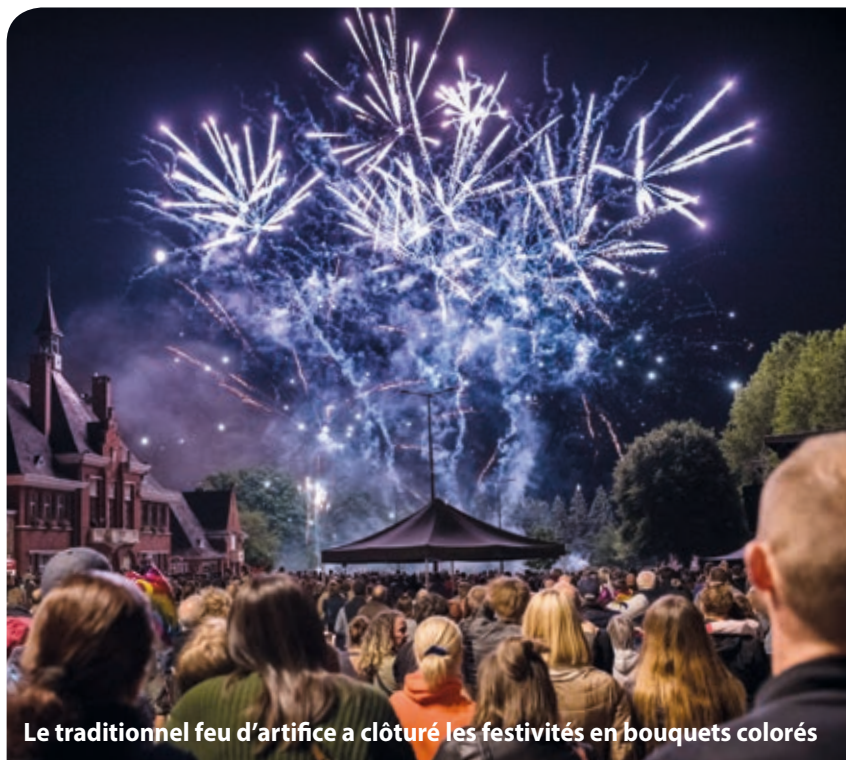
Le traditionnel feu d'artifice a clôturé les festivités en bouquets colorés