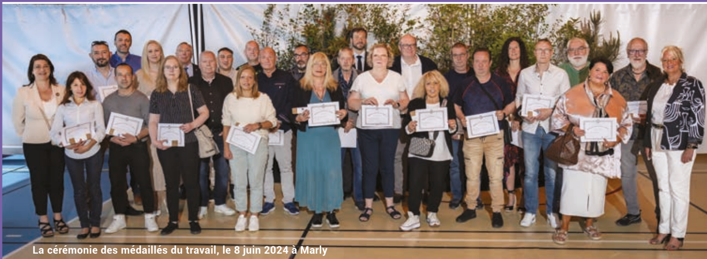
La cérémonie des médaillés du travail, le 8 juin 2024 à Marly