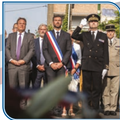
Dimanche 1 er septembre : commémoration de la libération de Marly - Valenciennes