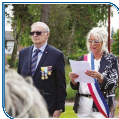
Samedi 8 juin : Journée nationale d'hommage aux Morts pour la France en Indochine.