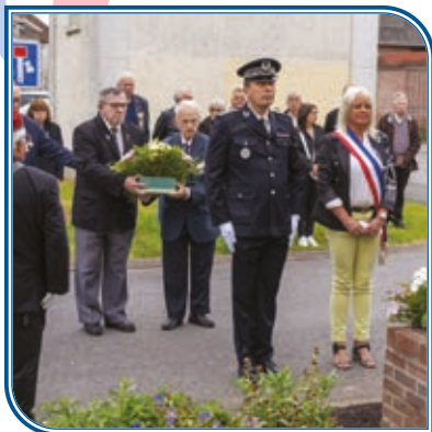
Mardi 18 juin : Journée nationale commémorative de l'appel historique du Général De Gaulle du 18 juin 1940 à refuser la défaite et à poursuivre le combat contre l'ennemi