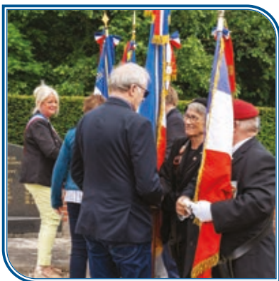
Lundi 27 mai : Journée nationale de la Résistance.