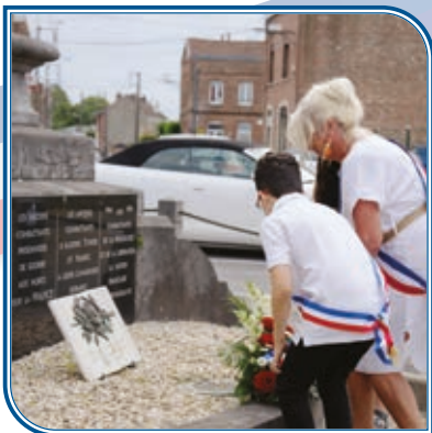
Dimanche 21 juillet : Journée Nationale à la mémoire des victimes des crimes racistes et antisémites de l'Etat français et d'hommage aux « justes » de France