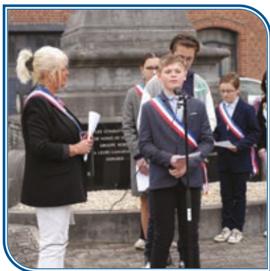
Mercredi 8 mai : Commémoration de la Victoire du 8 mai 1945.