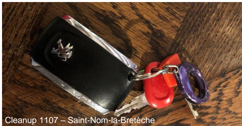
Cleanup 1107 – Saint-Nom-la-Bretèche