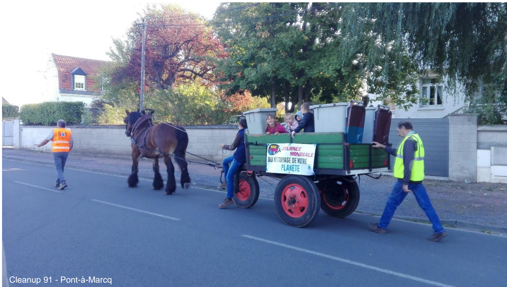
Cleanup 91 - Pont-à-Marcq