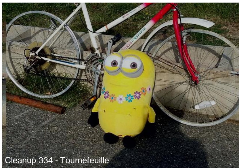
Cleanup 334 - Tournefeuille