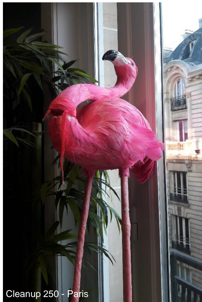
Cleanup 250 - Paris