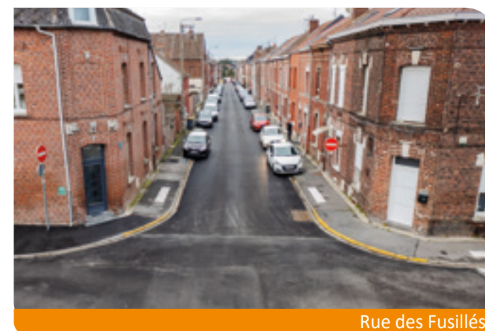
Rue des Fusillés

Totalement repensée, la place du Sergent Blary accueille désormais 18 places de stationnement en zone bleue, dont 1 place PMR. Les arbres ont été plantés, un cheminement piéton sécurisé a été dessiné, les voiries rue Roger Salengro et rue des Fusillés ont été rénovées, la circulation dans ce secteur est ainsi fluidifiée et sécurisée.