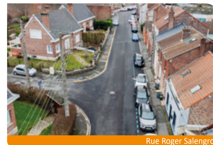
Rue Roger Salengro