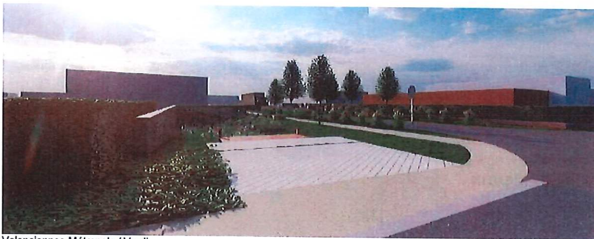
Valenciennes Métropole / Verdi

Cette nouvelle entrée de la ZAC des dix muids sur l'avenue Barbusse est aussi l'occasion de créer un nouveau signal permettant de mettre la zone en valeur :