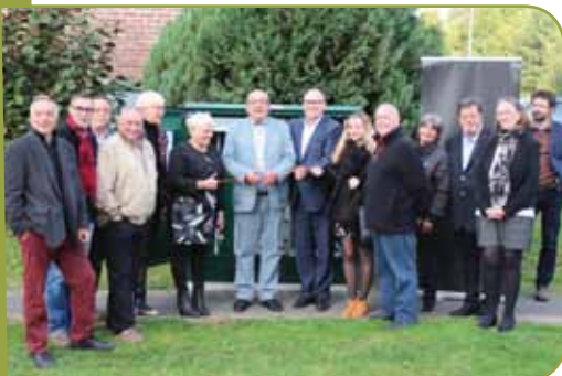
Plus tôt dans l'après-midi, avait été inaugurée l'armoire de branchement à la fibre de l'avenue des Lilas aux Floralies

Conscient de l'impatience des administrés sur ce sujet, M. le Maire s'est dit heureux qu'Orange ait entendu l'appel de la Ville de Marly et accepté de venir à la rencontre des habitants en demande d'une information la plus juste et actuelle possible.