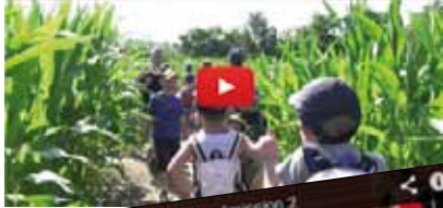
JT ALSH Louise Michel - émission 3

fresque, dessinée par une jeune Marlysiennne des Ateliers de Création du Moulin, Mosaïque qui trouvera sa place dans le quartier pour commémorer cet anniversaire particulier !