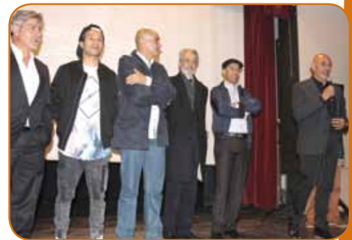
L'équipe du film remerciant la Municipalité de Marly pour cette avant-première réussie