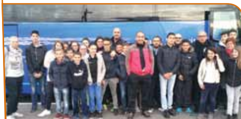
Les jeunes du LALP au départ de Nausicaa

Elle a aussi créé les LALP (Lieux d'Accueil et de Loisirs de Proximité) pour les 11/17 ans des quartiers des Floriales et de la Briquette.