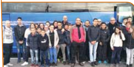
Les jeunes du LALP au départ de Nausicaa

Elle a aussi créé les LALP (Lieux d'Accueil et de Loisirs de Proximité) pour les 11/17 ans des quartiers des Florallies et de la Briquette.