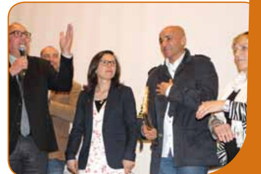
Après cette projection, le réalisateur, très ému en voyant une salle rassemblée autour d'un sujet fort, une histoire commune