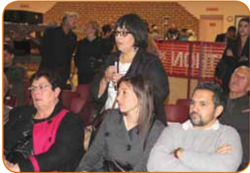
Visiblement bouleversée, le cœur serré, une dame dira toute sa reconnaissance et son admiration pour ce long métrage