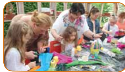
Un des nombreux ateliers mis en place lors de cette belle fête.