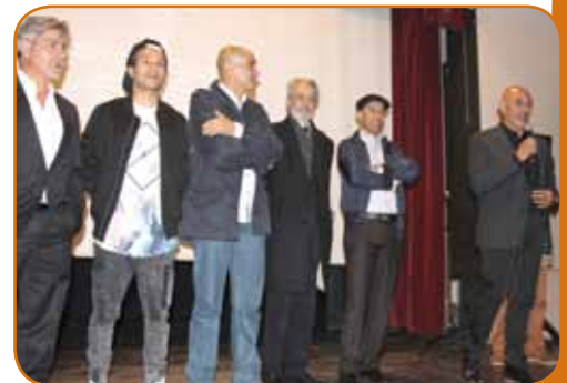
L'équipe du film remerciant la Municipalité de Marly pour cette avant-première réussie