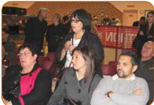
Visiblement bouleversée, le cœur serré, une dame dira toute sa reconnaissance et son admiration pour ce long métrage