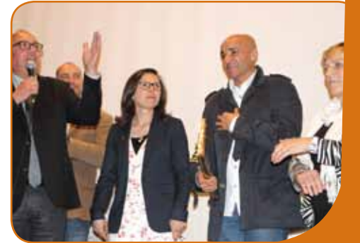
Après cette projection, le réalisateur, très ému en voyant une salle rassemblée autour d'un sujet fort, une histoire commune