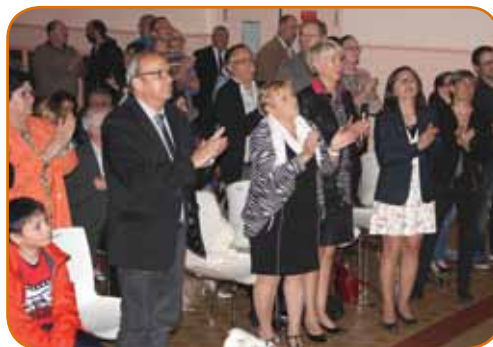
Le public a applaudi et est resté debout plusieurs minutes dans la salle après le générique de fin