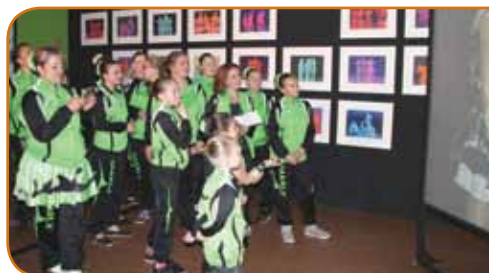
Les majorettes de Marly «Les Amaryllis» ont pris un réel plaisir à participer à cette action à la découverte de l'art contemporain...