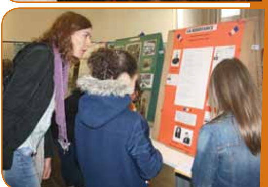
Plusieurs classes ont visité l'exposition sur «La résistance» du 24 au 27 mai 2016