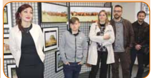
Au Vernissage de l'Exposition «Kenya»