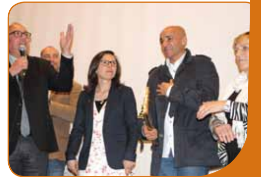
Après cette projection, le réalisateur, très ému en voyant une salle rassemblée autour d'un sujet fort, une histoire commune