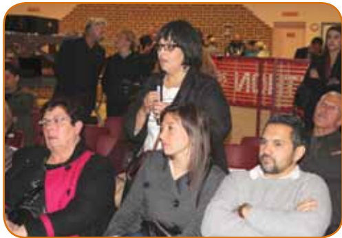
Visiblement bouleversée, le cœur serré, une dame dira toute sa reconnaissance et son admiration pour ce long métrage