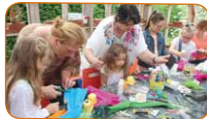
Un des nombreux ateliers mis en place lors de cette belle fête.