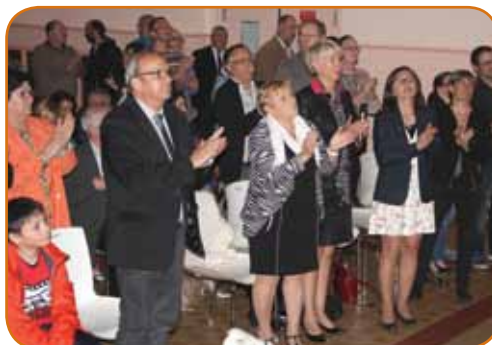
Le public a applaudi et est resté debout plusieurs minutes dans la salle après le générique de fin