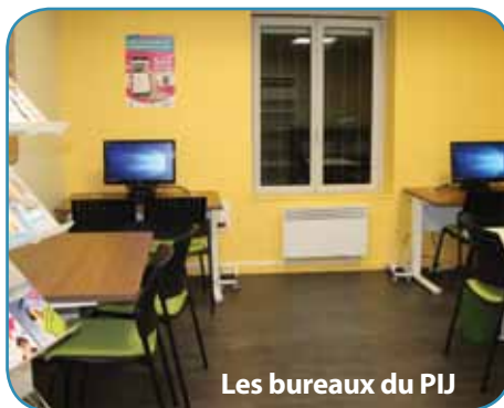
Les bureaux du PIJ

Le résultat est à la hauteur de l'investissement et au soir de l'inauguration, chacun s'émerveillait de la qualité d'une réalisation qui profitera donc aux associations hébergées mais aussi à d'autres clubs et associations grâce, notamment, à la salle de réunion qui pourra être mise à leur disposition, sur demande.