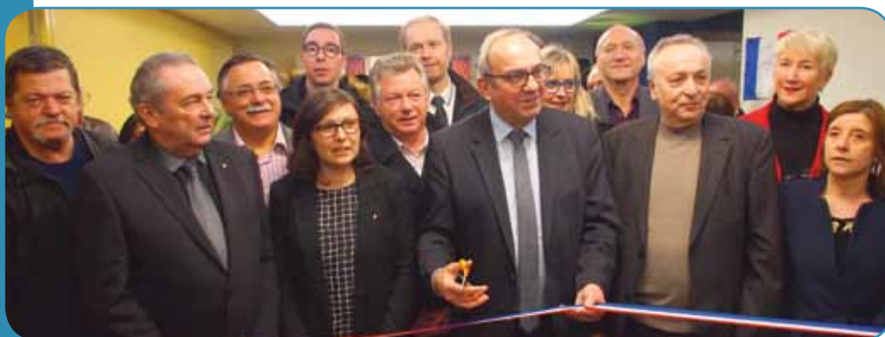
Avant les traditionnels discours, le 1 er Magistrat, entouré de l'équipe municipale et des personnalités, coupe le ruban tricolore

À ce titre, trois associations d'insertion ont été sollicitées : Poinfor, Espoir et C2RI, chacune intervenant dans un ou plusieurs