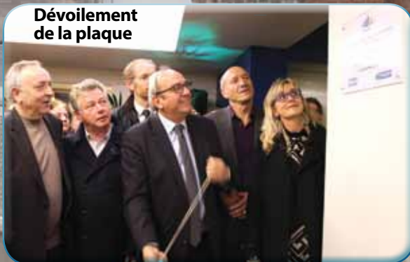
Dévoilement de la plaque