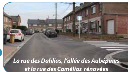
La rue des Dahlias, l'allée des Aubépines et la rue des Camélias rénovées

D'autres travaux sont prévus aux Florilys en 2016 rues des Lys, des Tulipes et des Violettes.