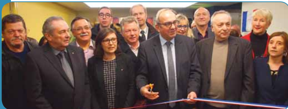
Avant les traditionnels discours, le 1 er Magistrat, entouré de l'équipe municipale et des personnalités, coupe le ruban tricolore

À ce titre, trois associations d'insertion ont été sollicitées : Poinfor, Espoir et C2RI, chacune intervenant dans un ou plusieurs