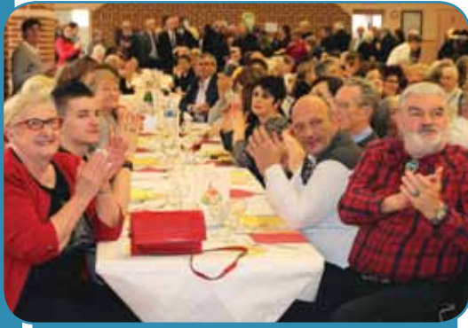
Une partie des convives applaudissant les heureux gagnants de la tombola

Et ce dimanche 07 février 2016, l'ambiance conviviale, la joie et la bonne humeur étaient, une fois de plus au rendez-vous.