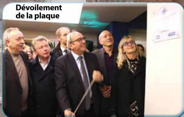
Dévoilement de la plaque