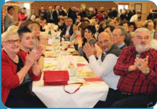
Une partie des convives applaudissant les heureux gagnants de la tombola

Et ce dimanche 07 février 2016, l'ambiance conviviale, la joie et la bonne humeur étaient, une fois de plus au rendez-vous.