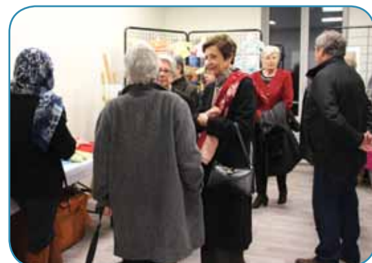
La visite des différents locaux