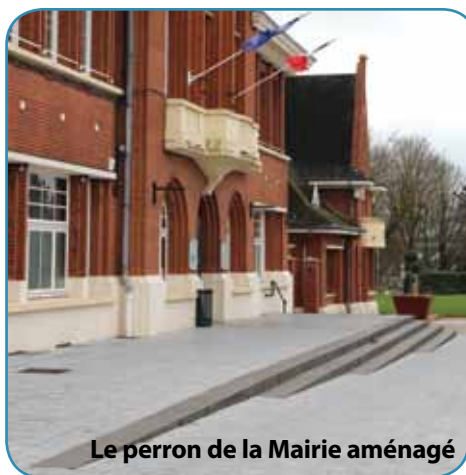
Le perron de la Mairie aménagé

Ces travaux de mise en conformité ont été intégrés aux chantiers de rénovation ou de construction des différents bâtiments communaux, à l'image des salles des sports du Caillou (Floralies) et Aragon (la Briquette), de la maison de quartier de la Briquette, de la maison des associations (rue des Ateliers) et, bien sûr, de l'Hôtel de Ville et de la salle des mariages, avec notamment la création d'un parvis avec rampe d'accès intégrée et installation d'une sonnette à l'entrée de la mairie.